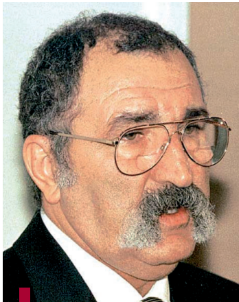
Ion Tiriac, presidente de Tiriac Investment

En esta nueva sociedad, participada al 50% por ambas compañías, se unen la experiencia de Riofisa y el conocimiento del mercado local por parte de Tiriac Investment. En este sentido, ambas compañías ya están analizando distintas alternativas por todo el territorio rumano, existiendo ya dos proyectos con grandes posibilidades de ser desarrollados a corto plazo.